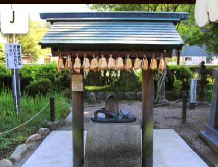
足腰の神様と言われる県指定文化財の足助八幡宮には、足のデザインをしたお守りがある。 Let's play for a health of the lower part of the body. There are foot-shaped votive picture tablets and lucky charms.