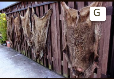
老舗料理屋「井筒亀」の軒先には、イノシシの毛皮がたくさん。 You can see furs of wild pigs.

制作: 足助女子会 発行: 第2回香嵐溪もみじまつり実行委員会 問合せ: 事務局 ☎ (0565) 62-1272