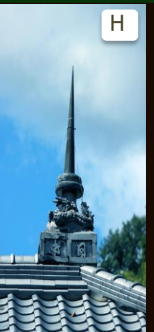
昔足助警察署だった商工会の屋根には、「日本」と書かれた避雷針が残っている。 It's a lightning rod. You can see a Chinese character of "日本" that means Japan. This is because this building was a police station in the past.