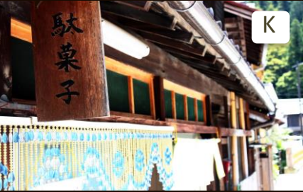
町の子も達が集まる駄菓子屋。 Children's favorite shop where sells cheap sweets.

Length: 1,800 meters/one way 距離: 約 1,800 m Time required: 40min/one way 時間: 約 40 分