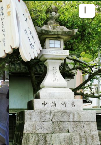
足助の古い町並み入口にある常夜灯。 In an entrance, there is a night-light. People play for fire prevention with lightning a candle every night in old days.